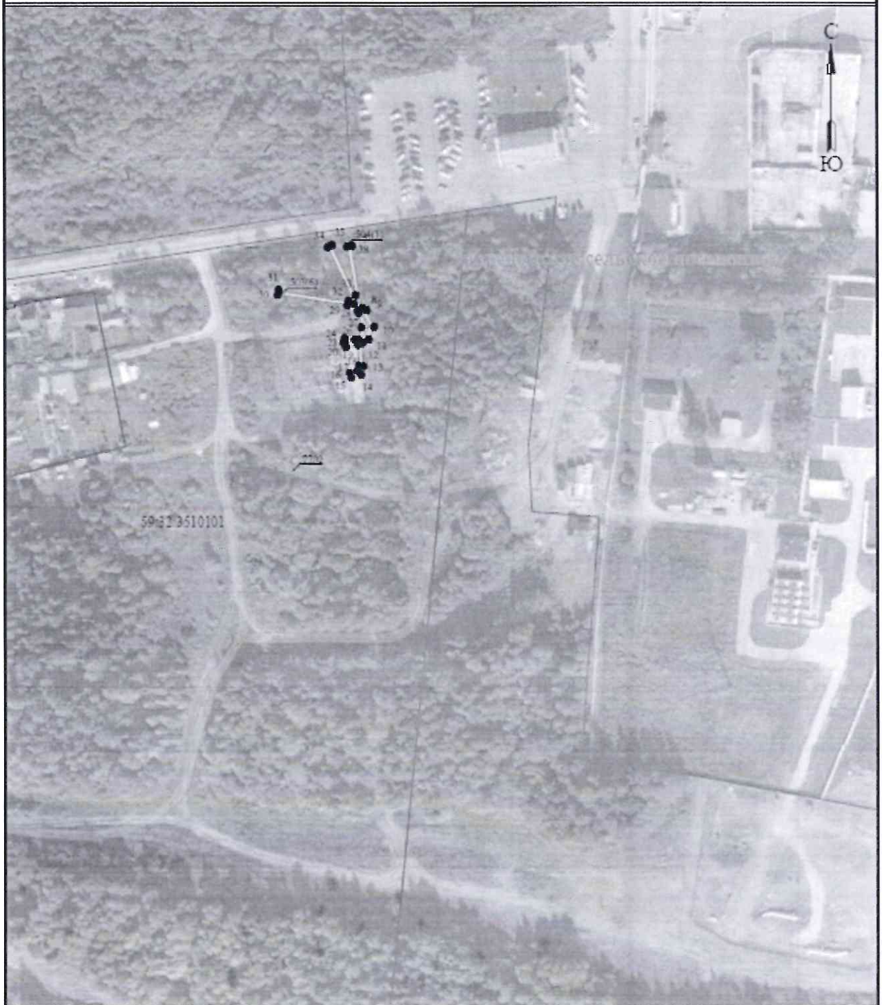
Схема расположения границ публичного сервитута для эксплуатации объекта электросетевого хозяйства ЭСК Подстанция 110/10 кВ «Сафроны» (ВЛ-10 кВ ф. Сафроны (отпайка от сущ. опоры 89), КЛ-10 кВ ф. Автобаза, ф. Броды, ф. Сафроны, ф. Сафроны (переход под ВЛ-110 кВ) (наименование объекта)